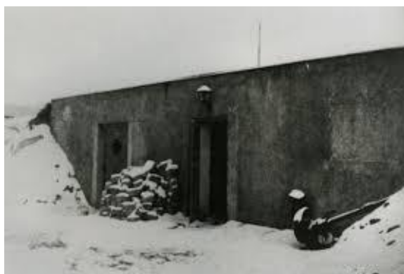
Krematoriet Auschwitz 1945 Påstods vara gaskammare