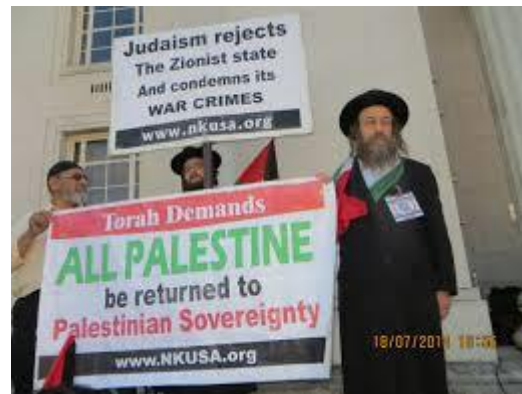
Judar demonstrerar mot sionismen

Winter menar också att berättelsen om Förintelsen används för att förtrycka och tysta alla diskussioner om ” ras, immigration och etiska frågor ” (sid. 100). Han menar exempelvis att begreppet ”Nazi” används för att ifrågasätta och diskriminera alla politiskt engagerade grupper som försöker driva frågan om rätten till sin egen nation och om värnandet om sin egen nationella identitet. Detta är ju något vi märker i Sverige, med anledning av den stora invandringen som sker just nu. Budskapet till ”nationalisterna” är att de som driver dessa frågor är ” endast ett steg från gaskamrarna ” (sid. 100). Winter betonar att det hela handlar om yttrande- och åsiktsfrihet. Dessutom är den officiella historien en allvarlig kränkning och historiskt orättfärdigt mot det tyska folket, som får leva med en enorm skuld.