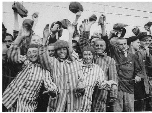
Kvinnliga och manliga fångar som hälsar amerikanarna välkomna vid koncentrationslägret i Dachau.