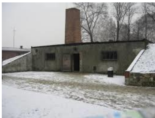
Skorstenen har blivit tillbyggd efter 1945 Fotot taget 2013

De anklagelser som fördes fram efter kriget om förintelsläger i Tyskland, visade sig inte ha kunna bevisas, varför anklagelserna lades ner. Det var svårare att undersöka påståendena om förintelsläger i Polen eftersom möjligheterna att undersöka omöjliggjordes på grund av ”järnridån” och den sovjetiska kontrollen. Det har senare visat sig att flera av dessa förintelsläger har varit rekonstruktioner som gjorts av Sovjet efter kriget (sid. 37). Det påstås att gasningarna skedde mellan åren 1942 till sent 1944. Bara det faktum att sex miljoner människor skulle ha mördats i dessa sex läger på lite mer än två år, borde vederlägga historien, skriver Winter.