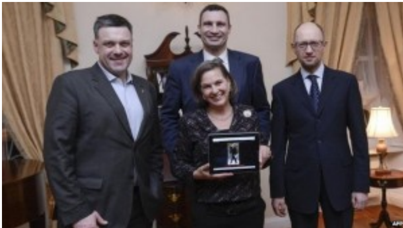
bild: Tyahnybok (ledare för nynazistiska Svoboda Party (vänster), Yatseniuk (höger)

Pyatt: Ja. Jag antar... när det gäller att han inte går in i regeringen, låt honom bara stanna ute och göra sina politiska läxor och sånt. Jag tänker bara i termer av den process som går framåt att vi vill hålla ihop de moderata demokraterna. Problemet kommer att vara Tyahnybok [Oleh Tyahnybok] , den andra oppositionsledaren] och hans killar och jag är säker på att det är en del av vad [president Viktor] Janukovitj beräknar på allt detta.