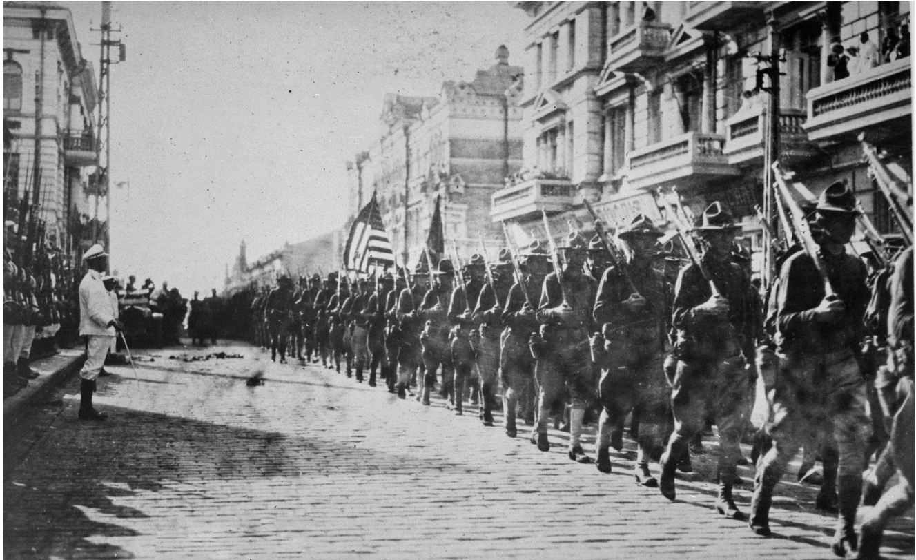
Amerikanska ockupationstrupper i Vladivostok 1918