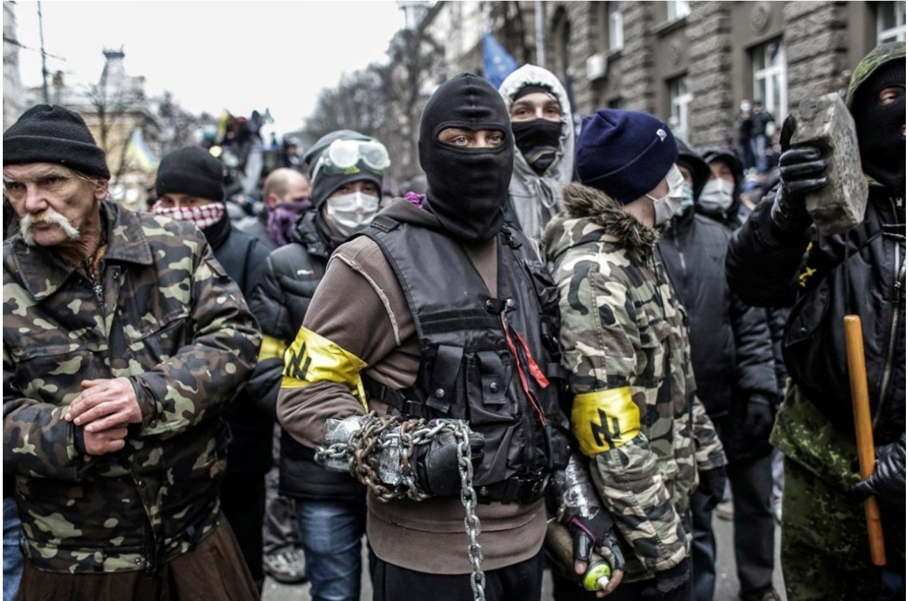
Right Sector, EuroMaidan 11 februari 2014

Skjutningarna av demonstranter av prickskyttar samordnades av Yarosh's Brown Shirts och Andriy Parubiy ledare för det nynazistiska Svoboda-partiet .