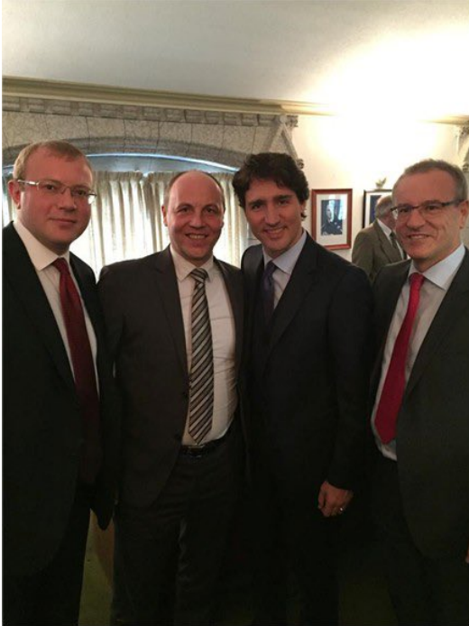
Canadian Prime Minister Justin Trudeau greets Ukrainian paramilitary extremist Andriy Parubiy in Ottawa on Feb 23, 2016

Därefter (2015-2019) blev han vice ordförande och ordförande för Verkhovna Rada (Ukrainas parlament) och gick över till den internationella diplomatins sfär på den nynazistiska regimens vägnar. Under sin karriär utvecklade Parubiy många kontakter i Nordamerika och Europa, med ledamöter av Europaparlamentet. Han bjöds in till Washington vid flera tillfällen och träffade (redan 2015) senator John McCain (ordförande) i senatens väpnade kommitté. Han blev också inbjuden till Ottawa och träffade premiärminister Justin Trudeau på Parliament Hill 2016.