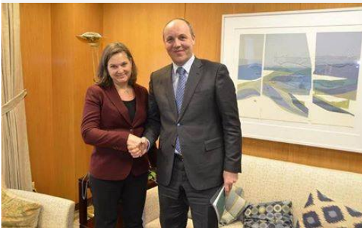
Victoria Nuland och Andriy Parubiy, 2018